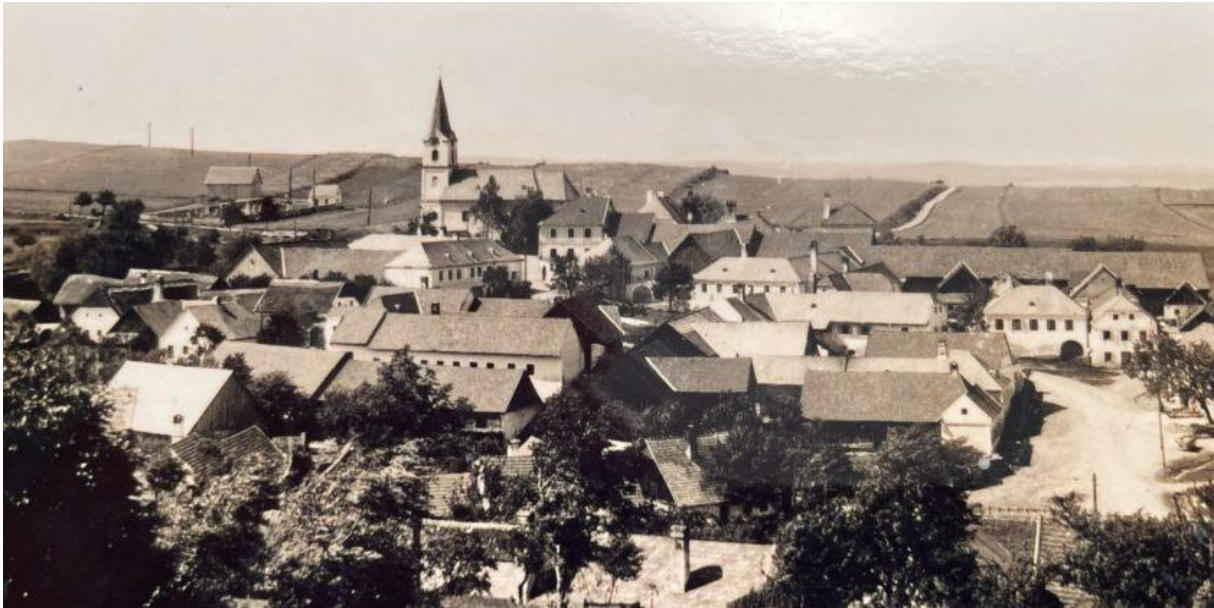
Weinzierl am Walde – mein Heimatdorf nach dem 2. Weltkrieg

der Pfarrer, der Schuldirektor und die größeren Bauern. Am unteren Ende der Hierarchie standen die Kleinhäusler, die Frauen und die Dienstboten.