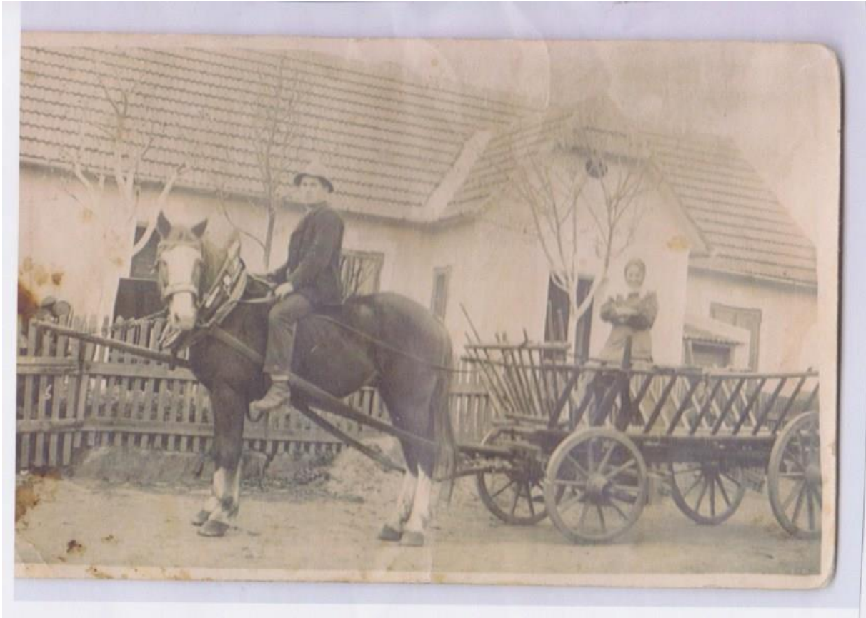
Mein Geburtshaus mit vorbei fahrendem Pferdefuhrwerk

Weinzierl am Walde wurde im Mittelalter als Weinarterbeiterdorf für die Weingüter in der nahen Wachau besiedelt. Die Einwohner hatten einen Bauernhof als Lehen und mussten dafür in den Weingärten arbeiten und Naturalien im Schloss Dürnstein abliefern. Mit der Aufhebung der Leibeigenschaft im Jahr 1848 gingen die Höfe in das Eigentum der Bauern über.