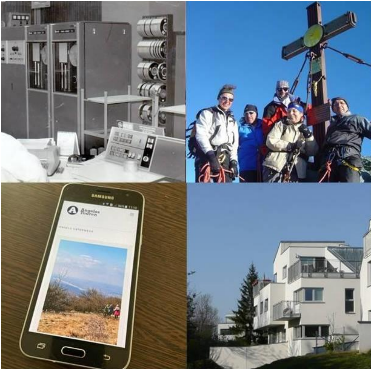
1917 IBM 360, 2006 Großglockner, 2015 Angelos Reisen am Smartphone, 2007 Wohnen am Liesingbach