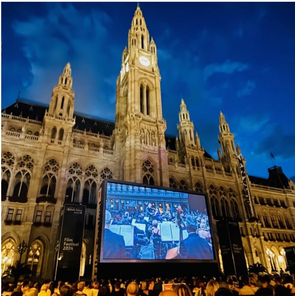
Filmfestival am Wiener Rathausplatz