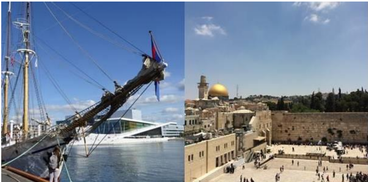
Hafen Oslo mit Oper, Klagemauer Jerusalem

Als Kind las ich viel und träumte von der Welt ausserhalb meines Heimatdorfes. Über Krems und St. Pölten führte mich der Weg nach Wien mit seinem reichhaltigen Freizeit- und Kulturangebot. Durch meine Arbeit lernte ich dann die österreichischen Landeshauptstädte kennen, vor allem Salzburg hatte es mir angetan. Meine erste Auslandsreise führte mich nach Prag und den ersten Auslandsurlaub verbrachte ich