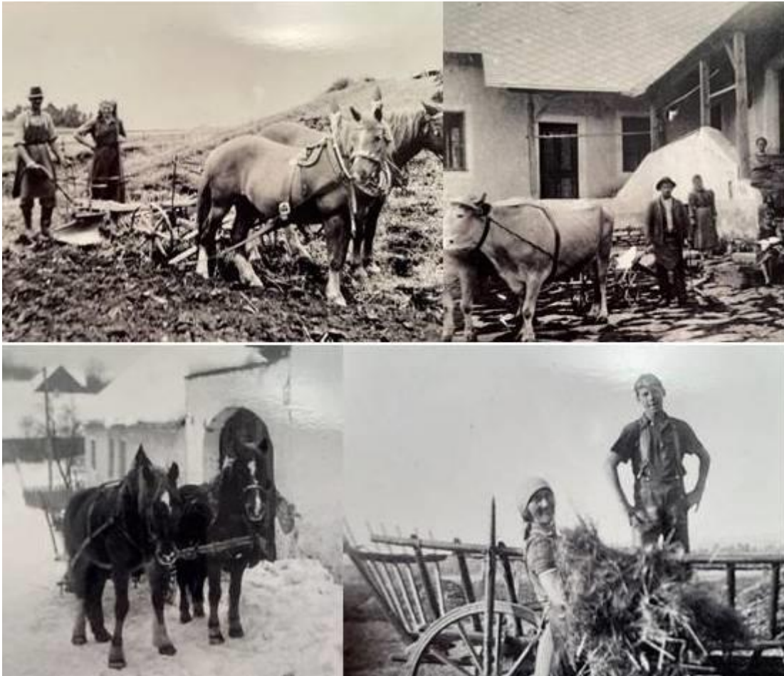
Ackern mit Pferden, Bauernhof mit Ochsespann, Pferdeschlitten, Heuernte

Das bäuerliche Leben hat sich über die Jahrhunderte nichts geändert. Außer Pflug, Egge, Sense und Dreschflegel gab es keine landwirtschaftlichen Geräte. Nutztiere waren Rinder, Schweine und Hühner. Traktoren und Autos gab es keine, Zugtiere waren Ochsen, Pferde und auch Kühe. Am Hof lebten im Schnitt 10 Bewohner – neben den Besitzern und deren Kindern noch oft die Altbauern, unverheiratete Geschwister und Dienstboten. Die Bauernhöfe waren Selbstversorger, Schweine wurden am Hof geschlachtet und das Fleisch geräuchert. Brot wurde mit dem geernteten Getreide selbst gebacken. Obst und Gemüse kamen aus dem eigenen Garten und das Heizmaterial für den Küchenherd (ein Kachelofen war Luxus) aus dem eigenen Wald. Abfälle wurden an das Vieh verfüttert oder kompostiert, durch die Kreislaufwirtschaft war Müll ein Fremdwort. Im Ortsgebiet wurde an der Krems ein Flusskraftwerk errichtet und so konnte Weinzierl bereits kurz nach dem ersten Weltkrieg an das Stromnetz angeschlossen werden. Damit war der erste Schritt weg von der reinen Handarbeit getan. Dreschmaschinen und Kreissägen erleichterten die Arbeit, Wohnräume und Ställe wurden beleuchtet.