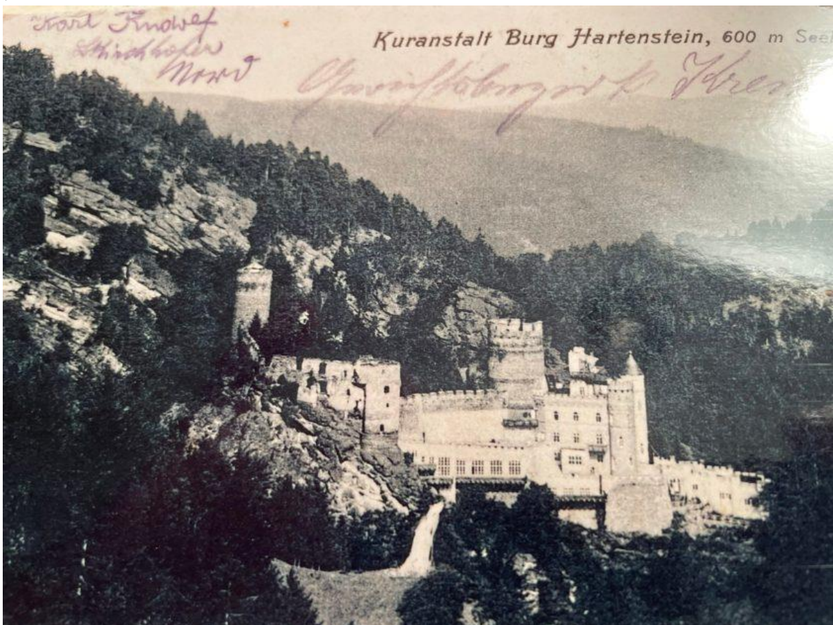
Burg Hartenstein um 1930

Sehenswert ist die Burg Hartenstein im Kremstal mit der darunterliegenden Gudenushöhle. Die Höhle wurde vor 70.000 Jahren von einer Gruppe Neandertaler frequentiert und ist eine der bedeutendsten steinzeitlichen Fundplätze Mitteleuropas